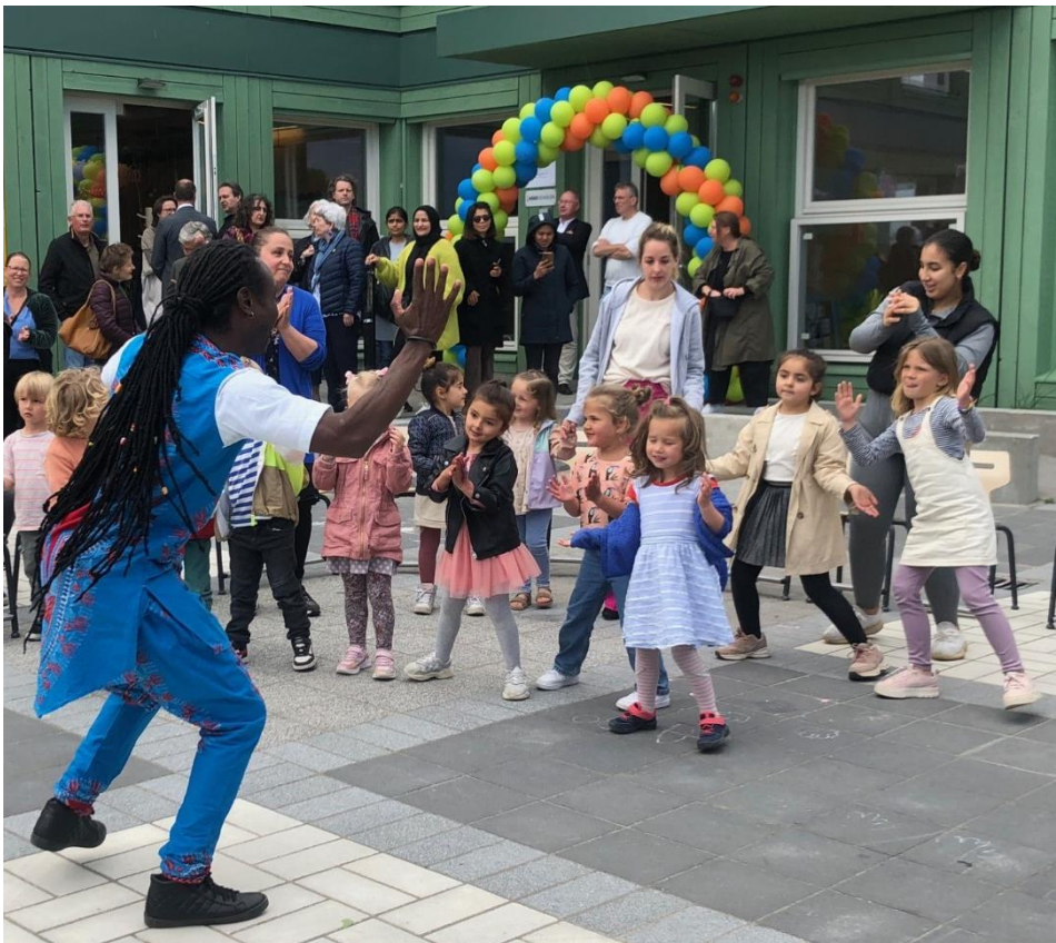
(Foto van feestelijke officiële opening van de school door wethouder Marjolein Moorman)